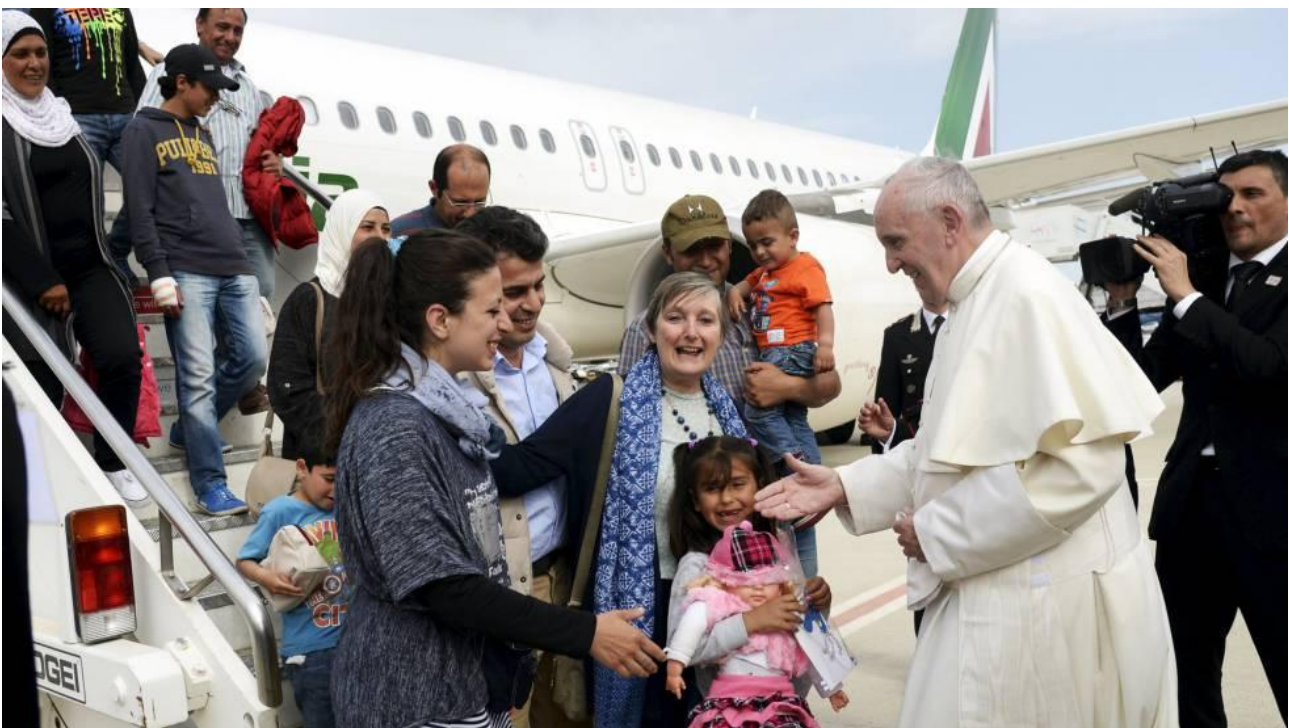
Los refugiados saludan al Pontífice a su llegada al aeropuerto de Roma

El papa Francisco , a los cuatro meses del ministerio petrino, fijó su posición contra la “globalización de la indiferencia” con una misa en la isla de Lampedusa, a cuya costa llegaban a diario cadáveres de refugiados ahogados. Tres años más tarde pronunció una declaración en los campos de refugiados de Lesbos (Grecia), reclamando a Europa que tenga ojos para ver la situación trágica de los que huyen de los virus de la guerra y el hambre, y pidiéndole que los acoja con dignidad. El papa mismo se llevó consigo a tres familias sirias con seis niños .