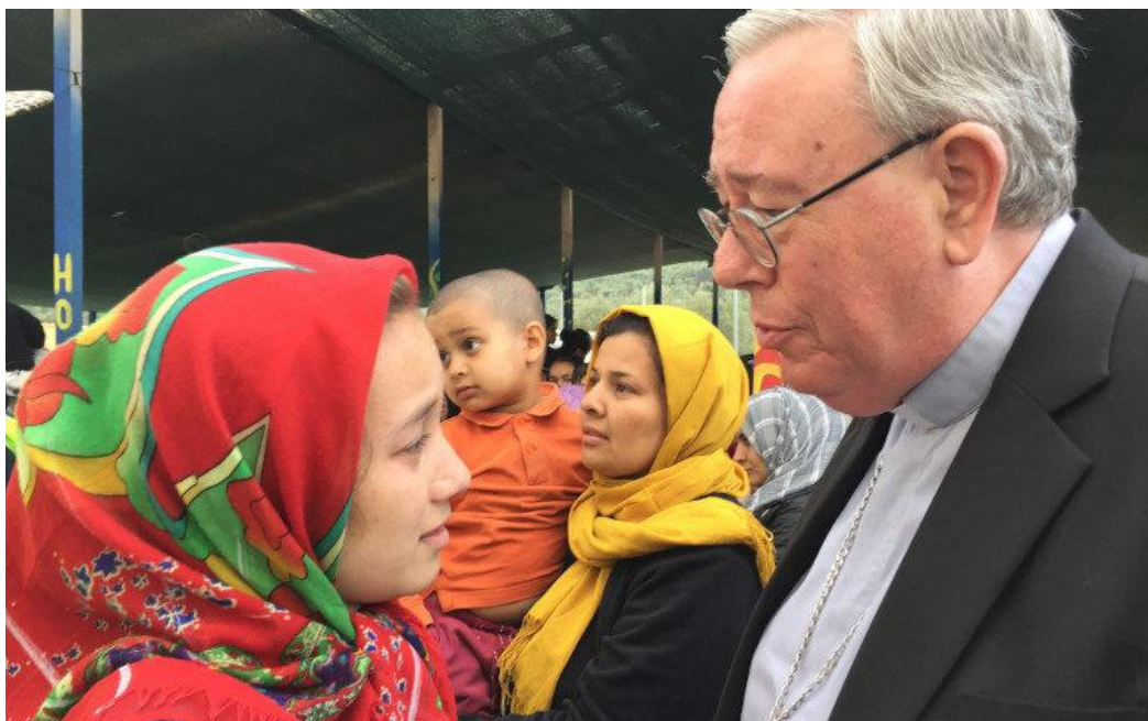
El cardenal Hollerich con una refugiada en Moria (Lesbos), en mayo de 2019.